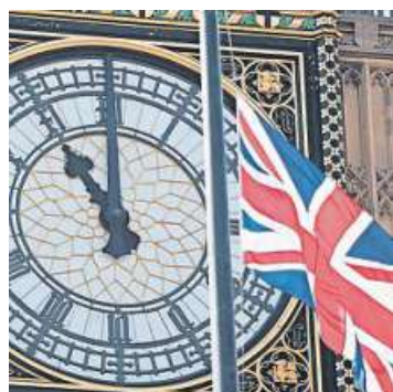
Europaweit spitze: London mit Big Ben.

Berlin. Berlin hat einer Umfrage zufolge seine Spitzenstellung als gefragtester Immobilienstandort in Europa an London verloren. Die britische Hauptstadt punktet auch nach dem Brexit mit ihrer Dynamik und dem Status als Drehkreuz, wie aus der am Mittwoch veröffentlichten Umfrage der Wirtschaftsprüfungs- und Beratungsgesellschaft PwC mit dem Urban Land Institute (ULI) hervorgeht. Die 844 befragten Entscheider von Immobilienfirmen, Investmentmanager und andere Branchenexperten in Europa betonten zudem die guten Renditeaussichten im Büro-