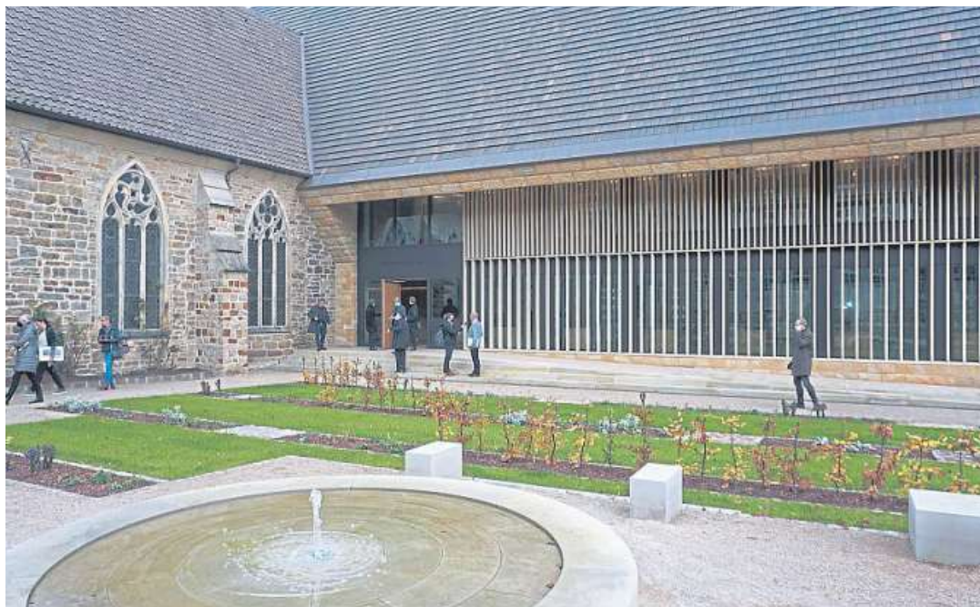
Die neue Bibliothek (rechts) und der neu gestaltete Außenbereich verbinden sich auf harmonische Weise mit den Bestandsgebäuden auf dem Klostergelände.

Die Finanzierung der Gesamtkosten der Baumaßnahmen in Höhe von 35,8 Millionen Euro sei durch Haushaltsmittel der Landeskirche sowie Zuwendungen Dritter in einer Größenordnung von rund 5,9 Millionen Euro (Kloster, VGH-Versicherungen, Klosterkammer Hannover, Bundes- und Landesmittel für